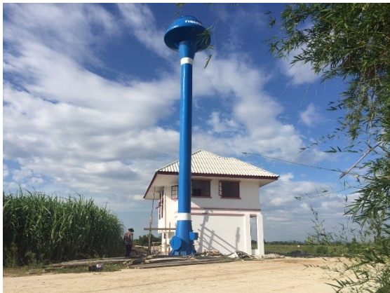
งานหอดึงแชมเปญ ขนาดความจุ ๑๕ ลูกบาศก์เมตร จำนวน ๑ แห่ง