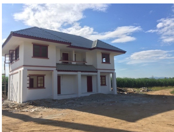
งานบ้านพักข้าราชการระดับ ๑ - ๒ ขนาด ๑๔๔ ตารางเมตร จำนวน ๑ แห่ง

กรมชลประทานจะดำเนินการก่อสร้างโครงการต่อไปจนแล้วเสร็จตามแผนในปี ๒๕๖๔ โดยมีลักษณะโครงการเป็นฝายทดน้ำพร้อมระบบส่งน้ำความยาวประมาณ ๘ กิโลเมตร