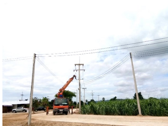
งานขยายเขตไฟฟ้าแรงสูง จำนวน ๑ แห่ง