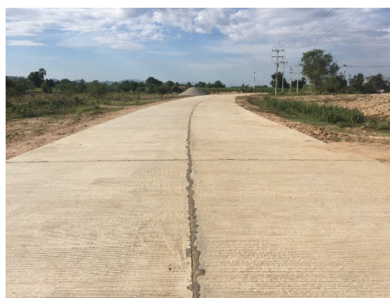
งานถนนเข้าห้วงงาน ความยาว ๑,๓๐๐ เมตร